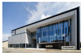
砺波工業株式会社 本社