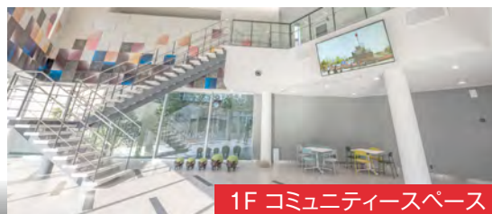
1F コミュニティスペース