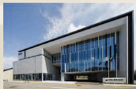
砺波工業株式会社 本社