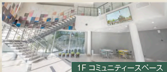
1F コミュニティスペース